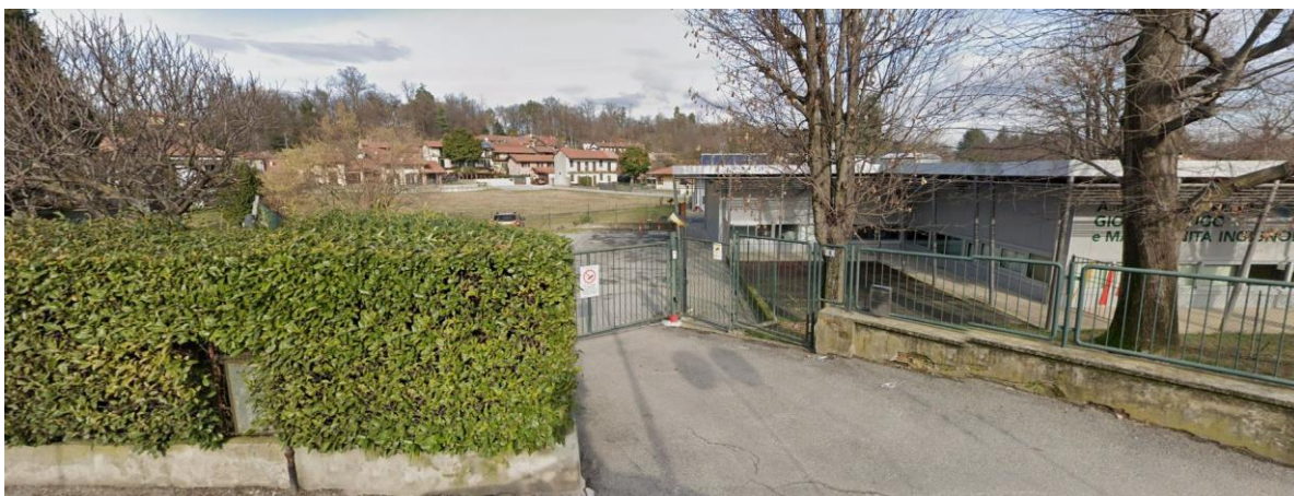
Vista 3 presa da via Circonvallazione