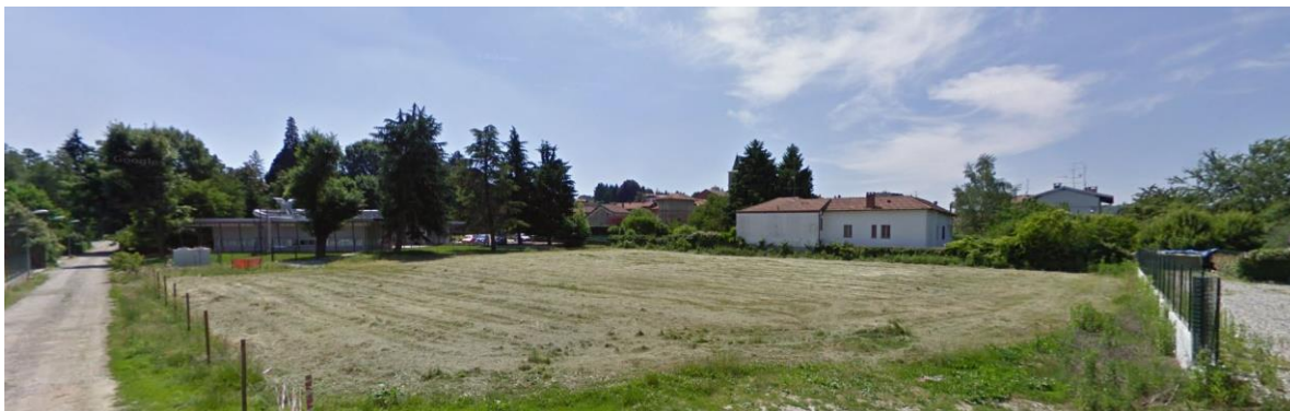
Vista 2 presa da via Ingnoli

REALIZZAZIONE DI UN POLO PER L'INFANZIA - NUOVO ASILO NIDO