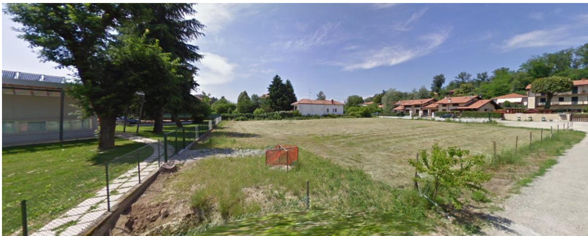
Vista 1 presa da via Ingnoli